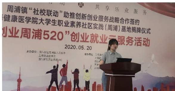
疫情下 HR 人才招聘活动

疫情期间，公司积极响应国家号召，落实国家疫情防控政策，有序复工复产，在2月中旬顺利成为上海市第一批复工复产的企业。在疫情之下，弘扬“勠力同心、共克时艰”的精神，构建和谐员工关系，发布《疫情之下，纽脉人如何应对?》的公告，安定员工情绪。关怀湖北员工生活状况，并解决返沪员工隔离期间的实际困难。疫情期间仍落实国家“稳就业、保民生”政策，不裁员、不降薪，积极参加上海市、浦东新区组织的人才招聘活动，并在2020年上半年招聘入职近50人。