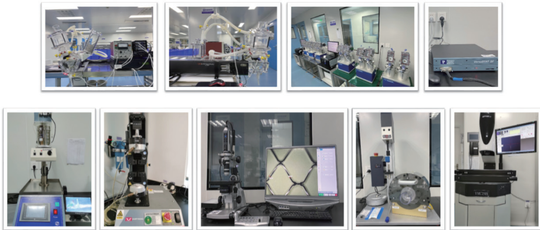
公司研发平台及基础设施

目前公司设有研发部、前沿技术部、研发支持部、生产部、工程部、临床评估部、临床与市场部、品质部、注册部、项目管理部、科技发展部、采购部、TC测试中心、财务部、人力资源部等部门，共百余人。研发人员比例占到公司员工比例的80%。团队针对临床大量亟需的瓣膜微创治疗现状，开发了多款经导管瓣膜置换及修复产品，同时和外部上百位医学专家共同研究产品的临床应用。团队人才专业互补，涵盖医用高分子及金属材料学、物理、化学、微生物、机械设计、理论力学、流体力学、生物工程学、有限元仿真、组织处理、临床等不同专业，为公司项目提供全面的技术支持。